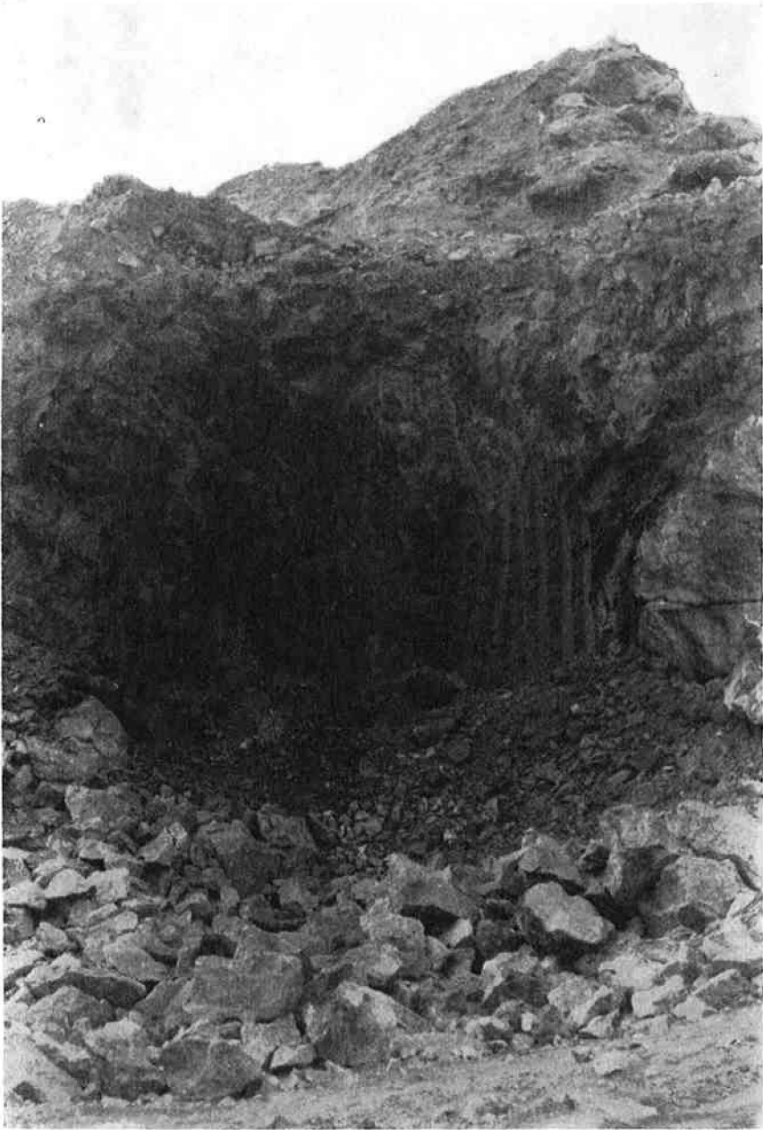
Abb. 4: Nicht abgebaute Ockerpartien im Karstschlot des Magnesit-Tagbaues.