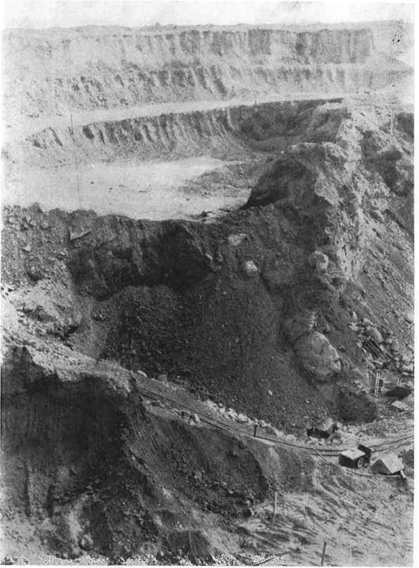
Abb. 3: Verschütten des Karstkamins mit Halde.