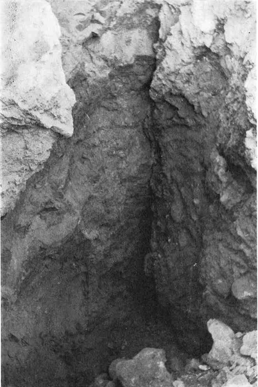
Abb. 2: Karstkamin (abgedeckt) im Magnesit-Tagbau.